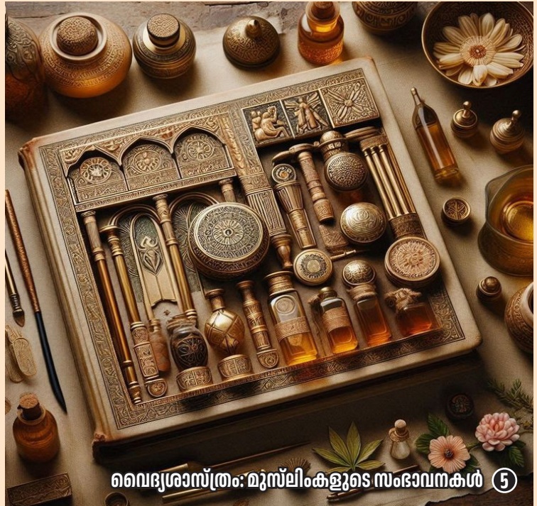
വൈദ്യശാസ്ത്രം: മുസ്ലിംകളുടെ സംഭാവനകൾ 5