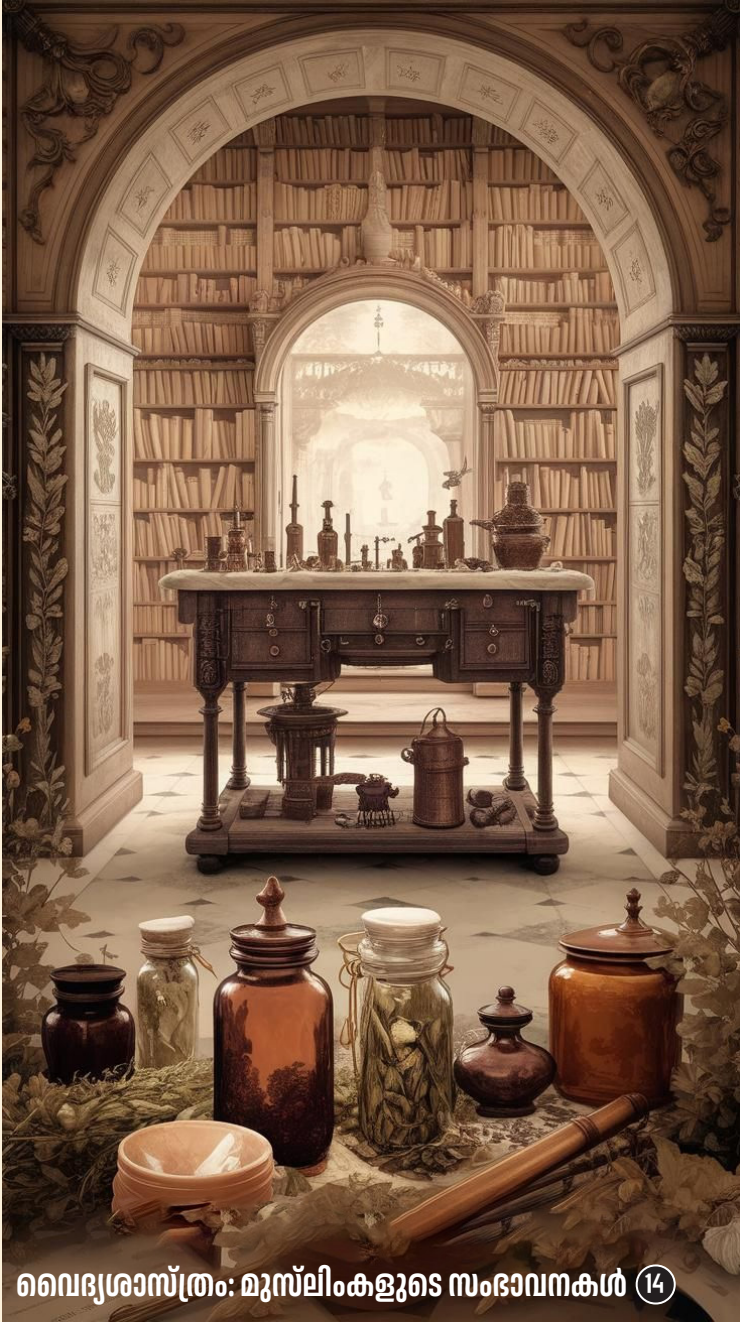
വൈദ്യശാസ്ത്രം: മുസ്ലിംകളുടെ സംഭാവനകൾ 14