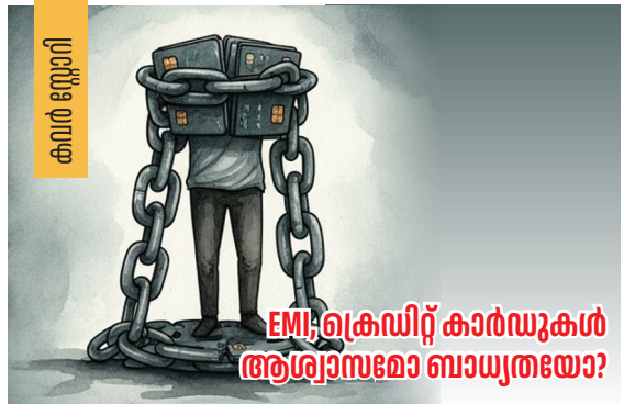
EMI-ക്രെഡിറ്റ് കാർഡുകൾ ആശ്വാസമോ ബാധ്യതയോ?

Printed, published & owned by: K. Sajjad Printed at : Sprint Offset Printers, Kozhikode Published at : Kozhikode - 673 002