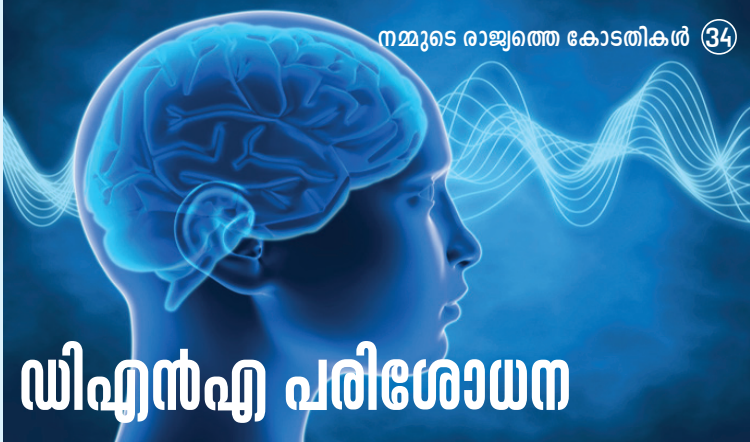
നമ്മുടെ രാജ്യത്തെ കോടതികൾ 34

മനുഷ്യകോശത്തിന്റെ ഈ സാമ്പിളുകളും (ഉദാ: കുറ്റവാളിയെന്നു സംശയിക്കപ്പെടുന്നയാളുടെ ശരീരകോശവും കുറ്റകൃത്യം