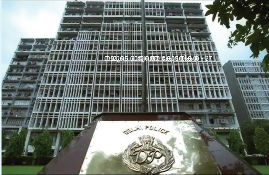
നമ്മുടെ രാജ്യത്തെ കോടതികൾ - 37

കേ രളത്തിലെ ക്രിമിനൽ കേസുകൾ തെളിയിക്കുന്നതിൽ പ്രശംസാർഹമായ പങ്കുവഹിച്ചു പോരുന്ന സംസ്ഥാന പൊലീസിലെ വിവിധ വിഭാഗങ്ങളെക്കുറിച്ചും പൊലീസ് വകുപ്പിന്റെ ഘടനയെക്കുറിച്ചും ചില കാര്യങ്ങൾ മനസ്സിലാക്കാം.