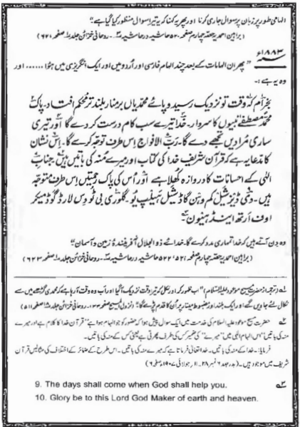
കുർആൻ എൻറെ വായിൽ നിന്ന്