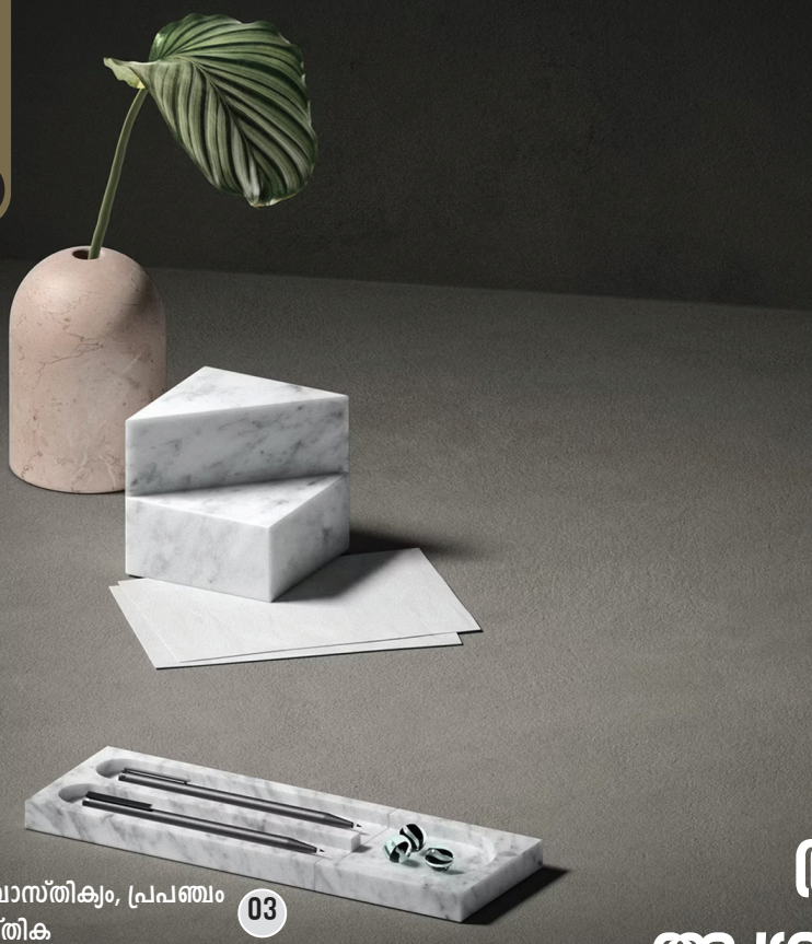
ദൈവാസ്തിക്യം, പ്രപഞ്ചം നാസ്തിക 03