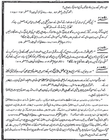
52ാം വയസ്സിൽ മരിക്കുന്ന ശത്രുക്കളെ സംബന്ധിച്ച പ്രവചനം

1891ൽ ഒരാളുടെ മരണം പ്രവചിക്കുന്ന ഒരു ഗണിതവഹ്യാ ഇങ്ങനെ വായിക്കാം: "ഒരു വ്യക്തിയുടെ മരണത്തെക്കുറിച്ച് അല്ലാഹു തഹജ്ജീ എണ്ണത്തിൽ എന്നെ വിവരം അറിയിച്ചു. അതിന്റെ ചുരുക്കം ഇങ്ങനെയാണ്: അതായത് അവൻ നായ, നായയുടെ എണ്ണത്തിൽ മരിക്കും. അതായത്