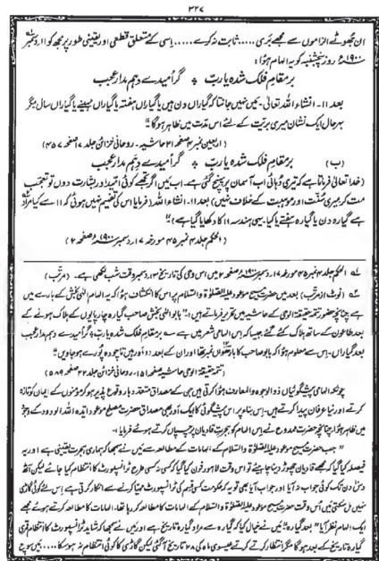
പ്രവാചകൻ മനസ്സിലാവാത്ത ഒരു ഗണിത വഹ്യാ

11.12.1900ന് അവതരിച്ച ഒരു പേർഷ്യൻ കവിതാവരിയും തുടർന്നുടനീളം അക്കവഹ്യാമാണ് ഇനി പറയുന്നത്: ‘എന്നെക്കുറിച്ച് പ്രചരിച്ച തെറ്റായ ആരോപണങ്ങളിൽനിന്ന് മുക്തനാകും മുമ്പേ ഞാൻ മരിച്ചു പോകുമെന്ന് എനിക്ക് വിശ്വസിക്കാനാവുന്നില്ല. അതിനെക്കുറിച്ച് 11.12.1900 വ്യാഴാഴ്ച ഒരു ഇൽഹാം ഉണ്ടായി. അല്ലാഹു പറയുന്നു: ‘നിന്റെ രോദനം ആകാശത്ത് എത്തിയിരിക്കുന്നു. ഞാൻ നിനക്ക് എന്തെങ്കിലും പ്രതീക്ഷയോ സുവാർത്തയോ തന്നാൽ നീ അതഭൂതപ്പെടേണ്ട. അത് എന്റെ നടപടിക്രമത്തിനോ (സുന്നത്ത്) ഒഴുദാര്യത്തിനോ എതിരാവില്ല.