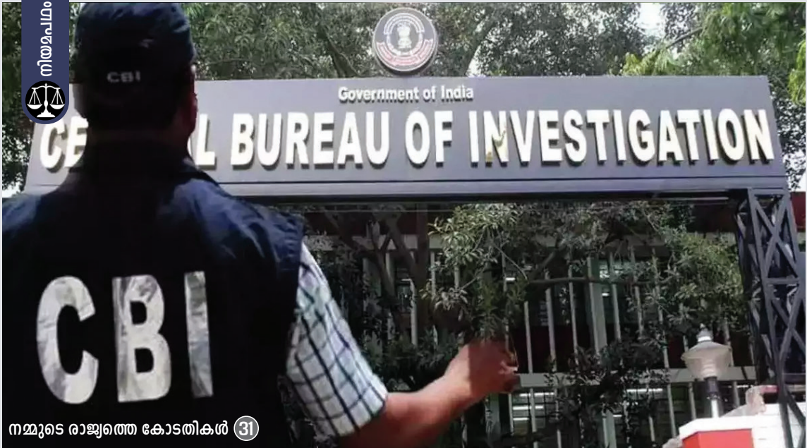
നമ്മുടെ രാജ്യത്തെ കോടതികൾ 31