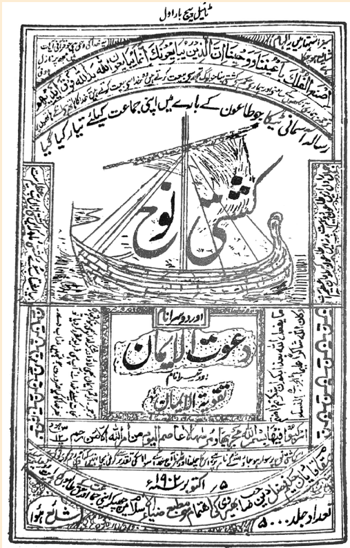
പ്ലേഗിൽ നിന്നുള്ള സുരക്ഷാ വാഗ്ദാനം വിശദീകരിക്കുന്ന ഖാദിയാനി ഗ്രന്ഥം, 'കൾതിയേ നൂഹ്' ഒന്നാം പതിപ്പിന്റെ ടൈറ്റിൽ പേജ്.