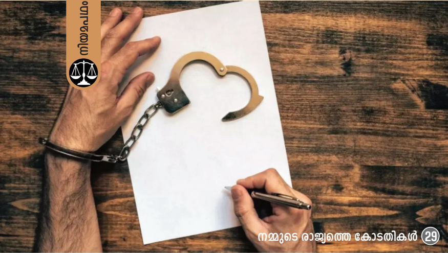
നമ്മുടെ രാജ്യത്തെ കോടതികൾ 29