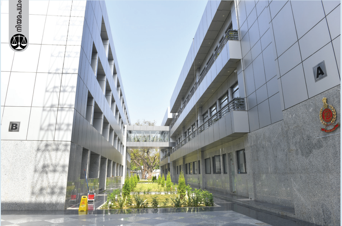
നമ്മുടെ രാജ്യത്തെ കോടതികൾ 32