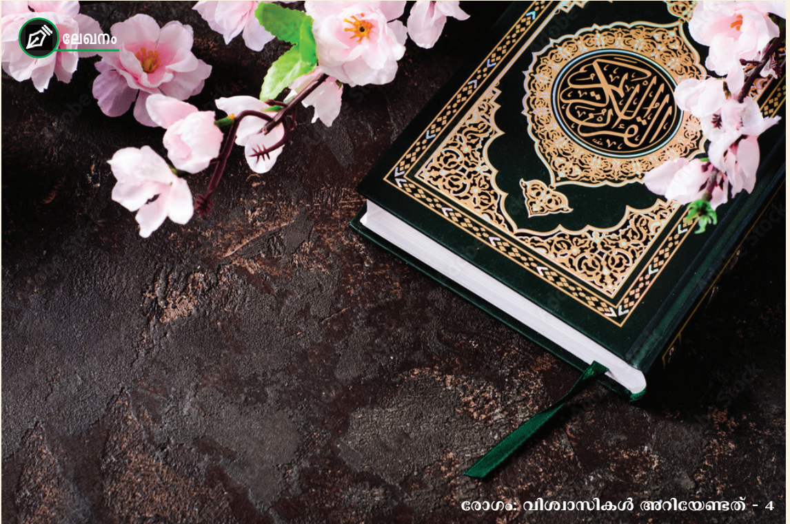
രോഗം: വിശ്വാസികൾ അറിയേണ്ടത് - 4