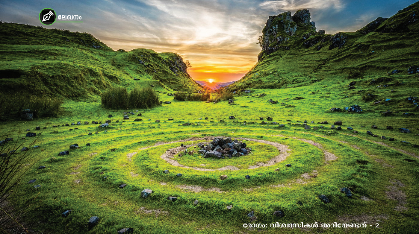
രോഗം: വിശ്വാസികൾ അറിയേണ്ടത് - 2