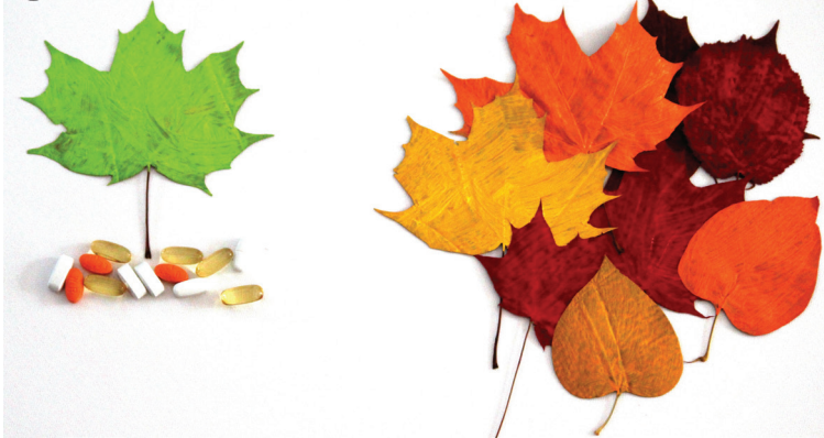
“ഒരു വിശ്വാസിയെ ബാധിക്കുന്ന എന്ത് ദീനവും ദുഃഖവും ദ്രോഹവും; എന്തിനേറെ മുളു് തറക്കുന്നത് പോലും-അതിലൂടെ അല്ലാഹു അവന്റെ പാപങ്ങൾ മായ്ച്ചുകളയുന്നു?” -നബി(സ്യ)