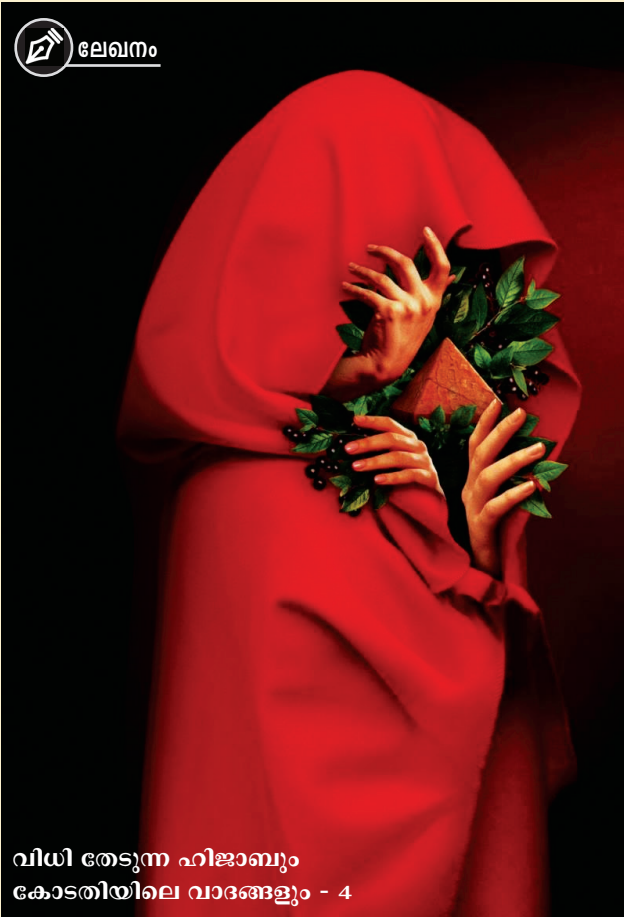
വിധി തേടുന്ന ഹിജാബും കോടതിയിലെ വാങ്ങേളും - 4