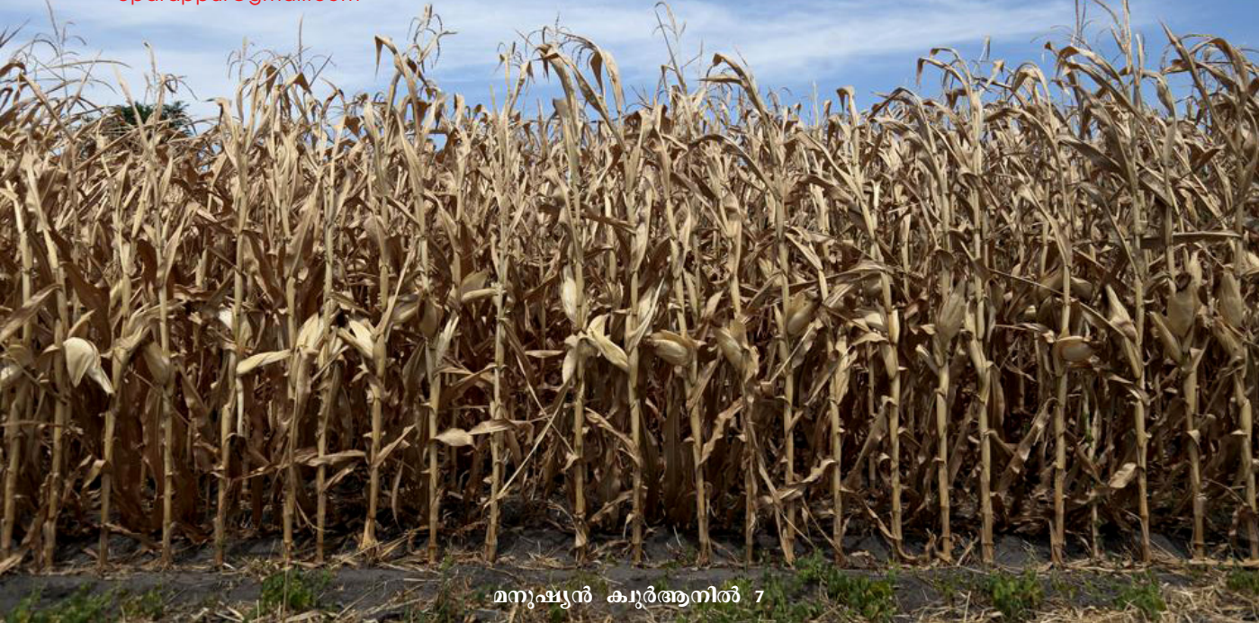
മനുഷ്യൻ കൂർആനിൽ 7