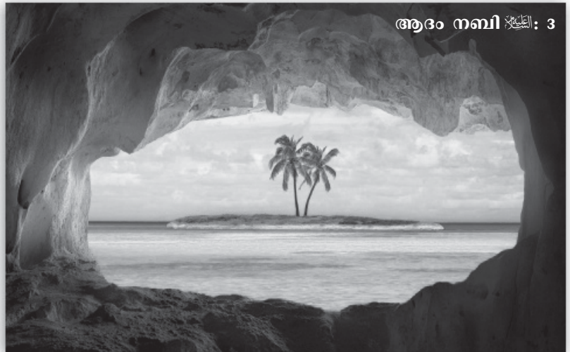
ആദം നബി ﷺ: 3