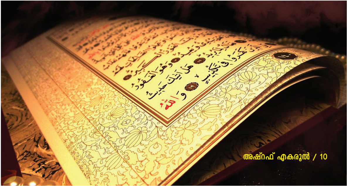
അഷ്റഫ് എകരൂൽ / 10